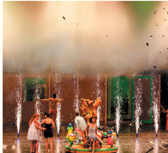
Sonho de uma noite de verão