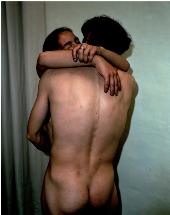
André Cepeda , Ontem, sem título , Porto, 2008, Ink Jet Print, 72,5 x 61 cm