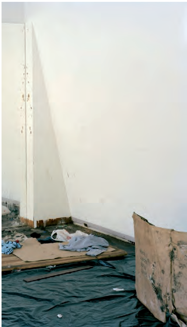
André Cepeda Ontem sem título Porto, 2008 Ink Jet Print 61 x 72,5 cm