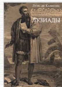
Os Lusíadas Luís de Camões Moscovo, Biblioteca Estatal de Línguas Estrangeiras, 2014, 430 p. ISBN: 978-5-00087-915-0