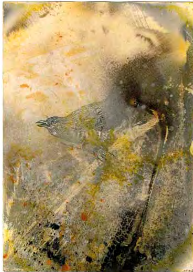
Eduardo Matos , technique mixte sur papier, extrait de la série Canal , résidence d'artiste à Bruxelles-Contretype, 2011, 29,3 x 20,9 cm

Ook hielden we even halt in de wijk waar auto's – en vermoedelijk ook heel wat andere